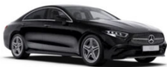
CLS Coupe facelift

Ισχύει από 10-Νοε-2022 [Αριθμός Πρωτοκόλλου 15193]